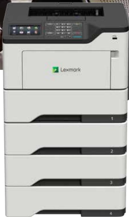
M3250 mit optionalen Fächern